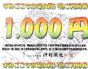
大きさはA4で背景は野菜の水彩画です

大きな盛り上がりを見せた第1回たもんじ交流農園フォトコンテストの受賞の方に副賞として「すみごごち市場お買い物ご利用券」が贈られました。尚、農園の作品展示は8月28日(土)迄とし、その後撤収させて頂きます(希望者には作品をお引渡し致します)。(末林和之記)