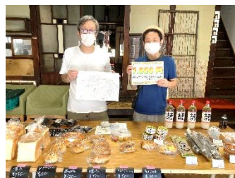
水彩画を描いて頂いた細井画伯と沖村氏