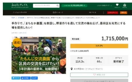
ふるさとチョイス GCF ページ：2019 年度のプロジェクトページ（達成マークあり）

今後も、地域住民や諸団体とのつながりを大切にしながら、区内外との交流促進によって、地域活性化にとどまらず、全国にこの魅力が届いてほしいと思います。目標額達成を祈願するとともに、たもんじ交流農園のさらなるアップデートを期待しています。